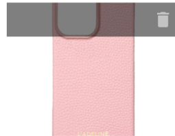
iPhone16 PINK COLOR