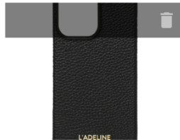
iPhone16 BLACK COLR