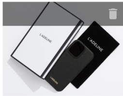
iPhone16 BLACK COLR