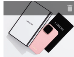
iPhone16 PINK COLOR